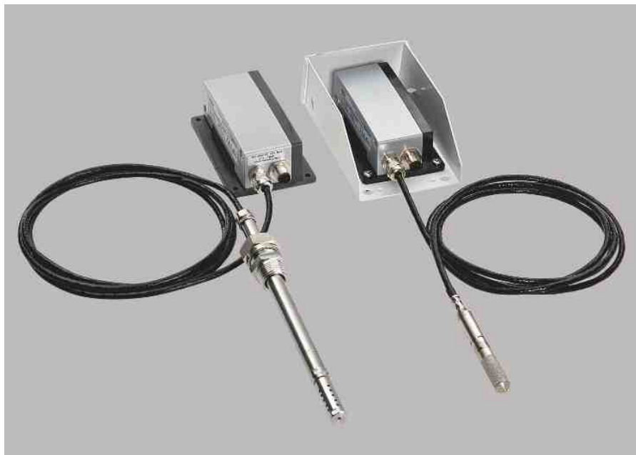
两种探头可选：MMT317和MMT318。另有防雨罩可供选配。